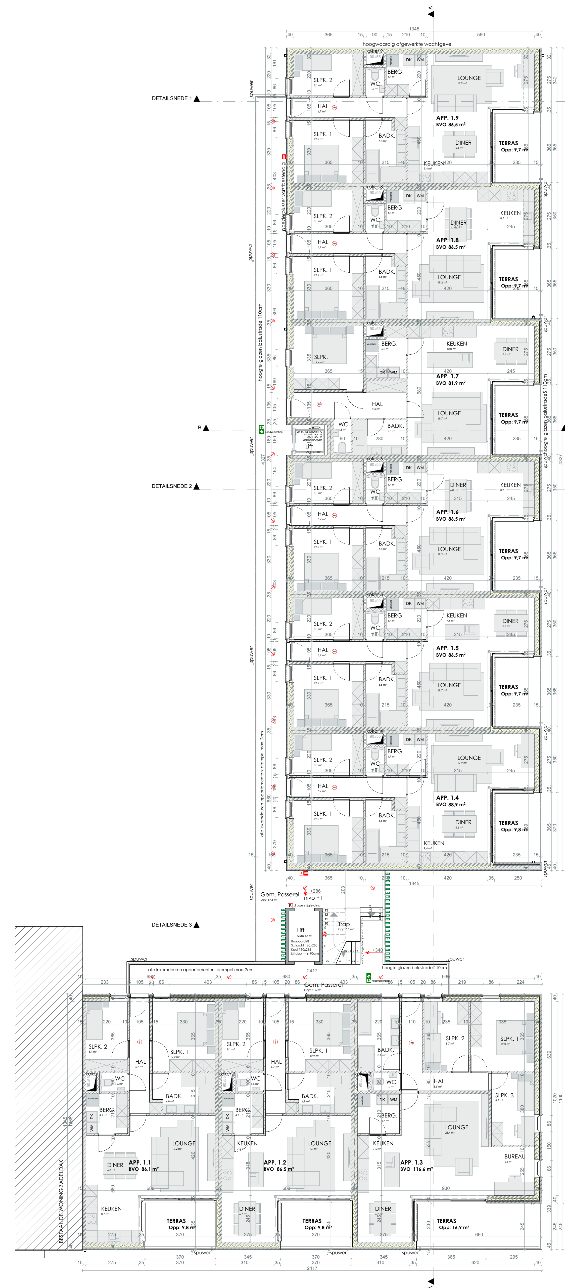
NIVEAU +1 1 / 100